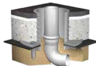
Variante: Curaflex® 4005/U als Sohlendurchführung